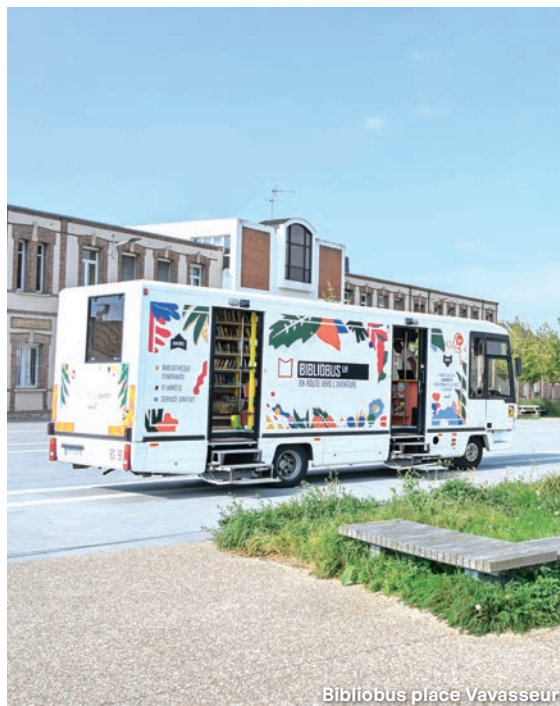
Bibliobus place Vavasseur

EP : La culture est pour moi une rencontre, un peu magique et parfois mystérieuse, entre un public, une œuvre, un artiste, un lieu. Notre ambition culturelle est, au fond, assez simple : créer les conditions pour que cette rencontre ait lieu, partout et pour tous ! Notre plus bel atout pour y parvenir tient à la richesse du tissu culturel et artistique local . À nous de le soutenir pour qu'il puisse durablement transmettre et faire rayonner la culture au Havre.