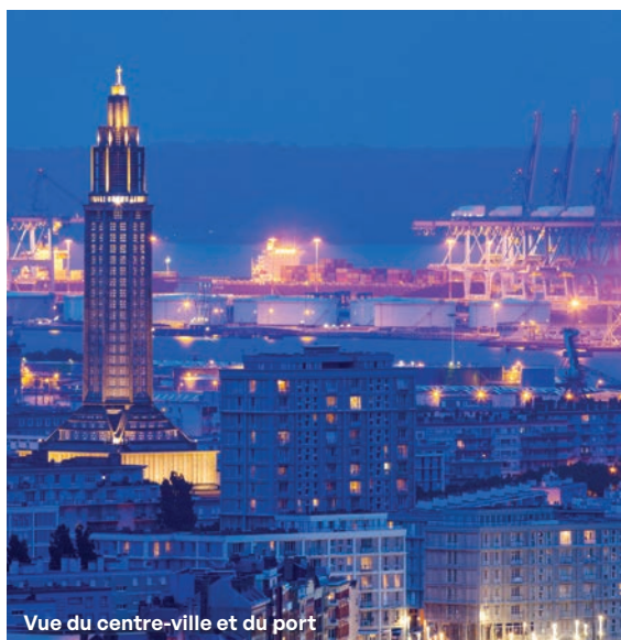
Vue du centre-ville et du port

Et puis disons les choses directement : je connais bien des villes qui affirment qu'elles sont pour le développement de l'industrie mais qui s'empressent de gêner tous les nouveaux projets... Au Havre, nous savons que l'industrie va de pair avec le port, que l'industrie crée de la richesse.