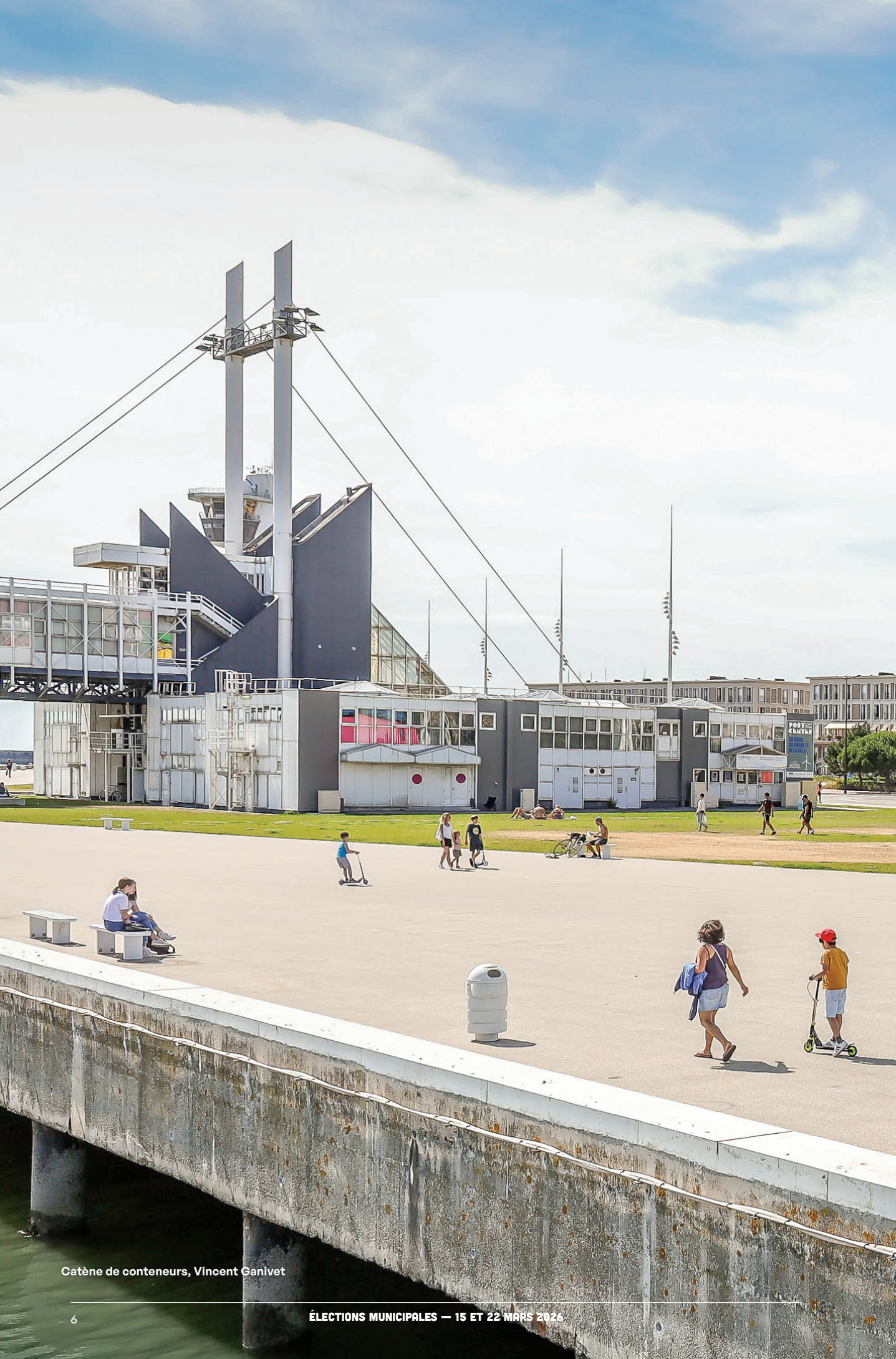
Catène de conteneurs, Vincent Ganivet