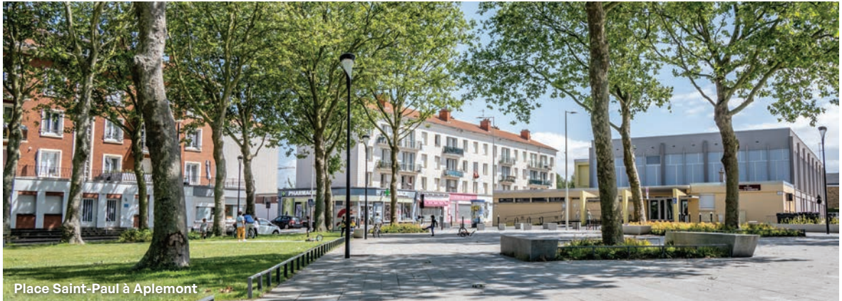
Place Saint-Paul à Aplemont