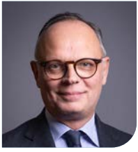
Édouard PHILIPPE 55 ans Maire du Havre