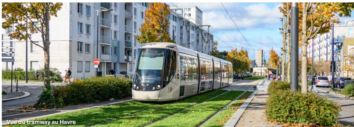
Vue du tramway au Havre

Nous prenons également très au sérieux l'enjeu de la consommation énergétique. Les mutations engagées sur le territoire sont très importantes pour opérer le virage de la transition énergétique. Le réseau de chaleur urbain en est un exemple emblématique : en valorisant la chaleur issue de la zone industrielle, nous produisons une énergie renouvelable, locale et à coût maîtrisé. Nous poursuivrons aussi les travaux de rénovation énergétique des bâtiments municipaux en développant notamment les énergies renouvelables (photovoltaïque, géothermie).