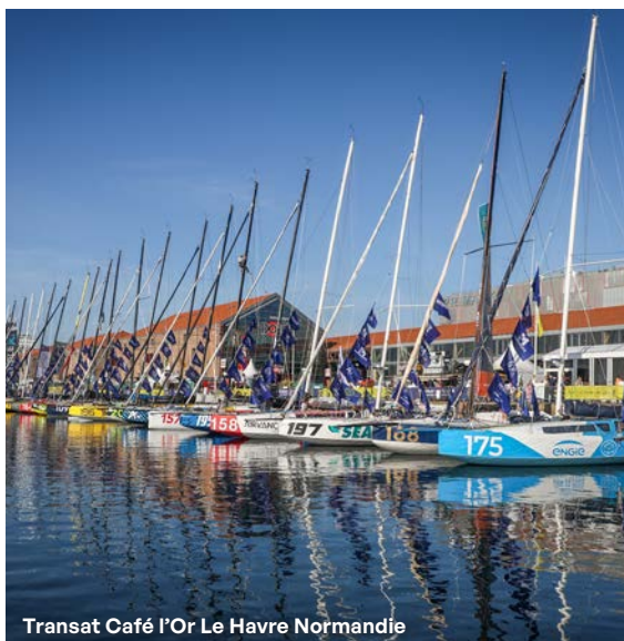
Transat Café l'Or Le Havre Normandie

Je n'oublie pas non plus la richesse culturelle que nous proposons à tous les publics, du MuMa au Muséum qui vient de rouvrir ses portes après avoir été totalement repensé. Et nous inaugurerons bientôt le Centre d'expositions Antoine Rufenacht pour l'art contemporain dans l'ancien espace Gaillot. De nouvelles collaborations sont aussi au programme, avec des institutions nationales comme le musée Guimet , musée national des arts asiatiques.