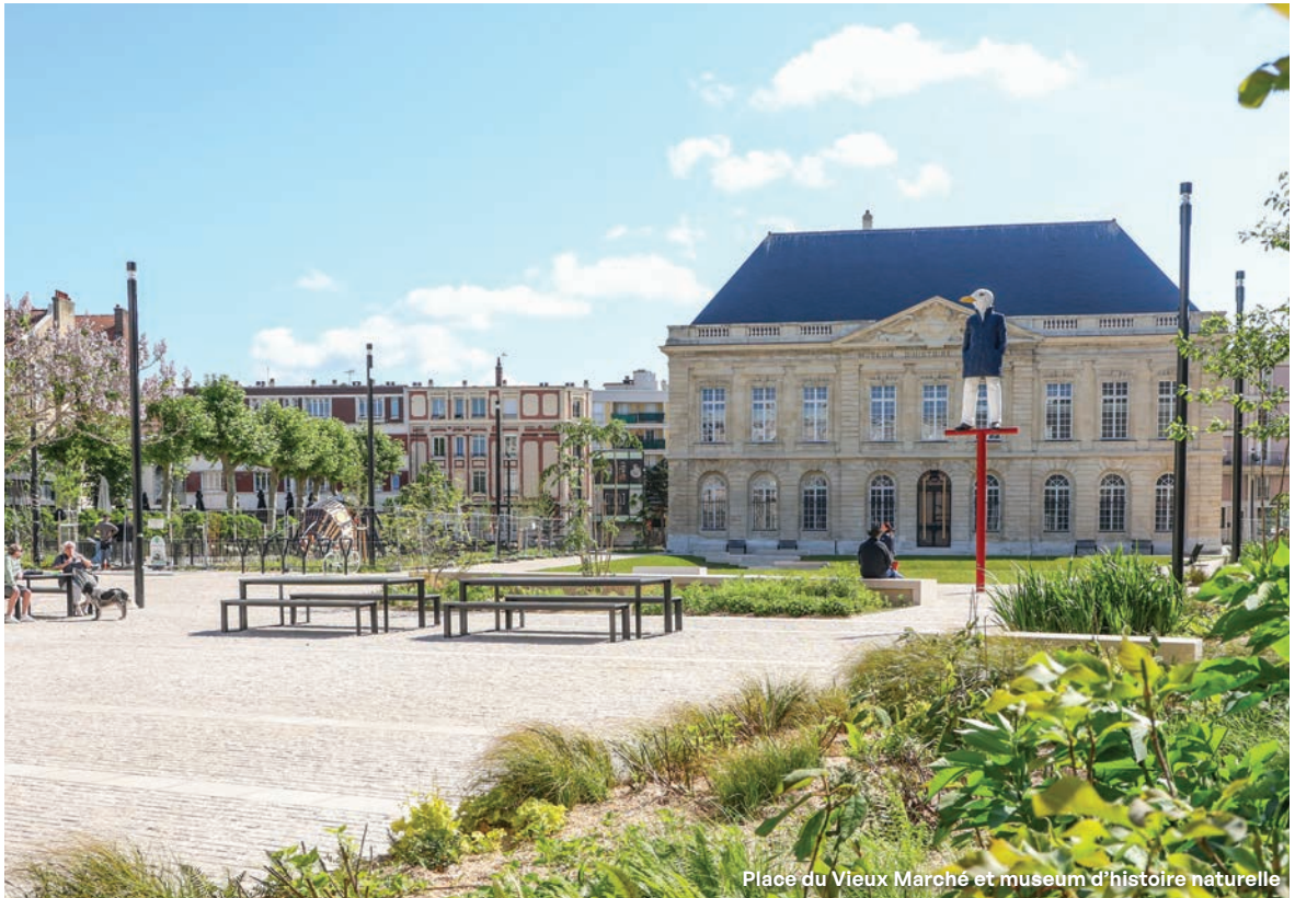
Place du Vieux Marché et museum d'histoire naturelle