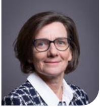
Agnès FIRMIN LE BODO 57 ans Députée, pharmacienne